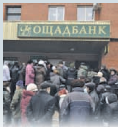
ЛЮДИ ПІД НАГЛЯДОМ