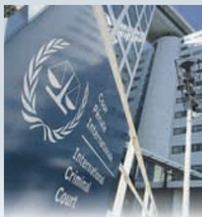
МУССОН В УКРАИНУ