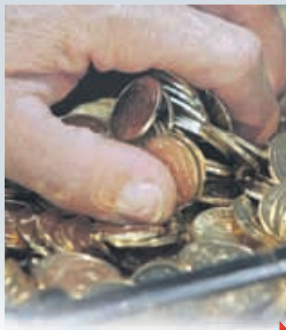
БЮДЖЕТ-2018: ОПТИМИСТИЧЕСКАЯ ТРАГЕДИЯ