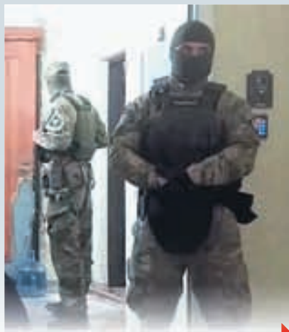
СТРАХ ПЕРЕД ИМПИЧМЕНТОМ?