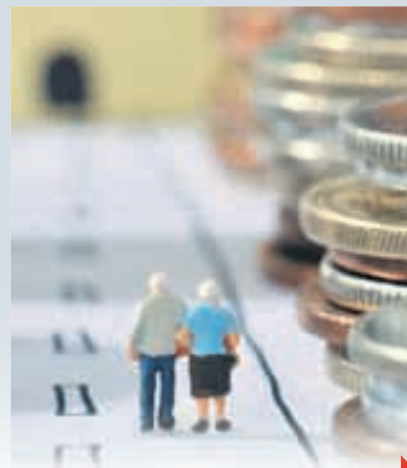
УКРАЇНЦІВ КИНУЛИ НА ЖЕРТОВНИК МВФ