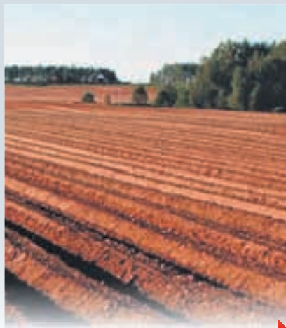
ОСТАННІЙ СКАРБ НАЦІЇ