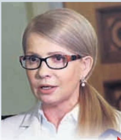
ТИМОШЕНКО — ЛІДЕР НОМЕР ОДИН