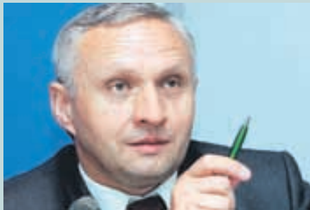
Іван ТОМИЧ, президент Асоціації фермерів України:

«Доки український народ не вирішив, чи хоче робити землю товаром, Верховна Рада не має ані політичного, ані морального права приймати закон про обіг сільськогосподарських земель».