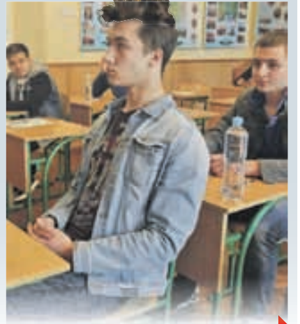
ВІК ЖИВИ, ВІК РЕФОРМУЙ