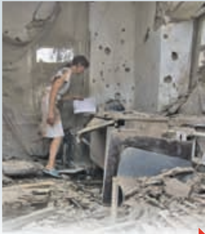
«ГРАДАМИ» ПО ДОНБАСУ