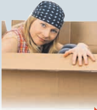
УКРАЇНЦІВ ЗАГАНЯЮТЬ У КОМУНАЛЬНЕ РАБСТВО