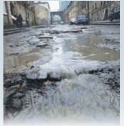
ЧОРНА ДІРА УКРАЇНСЬКОГО БЕЗДОРИЖЖЯ