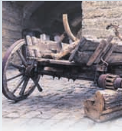
А ЦВК І НИНІ ТАМ