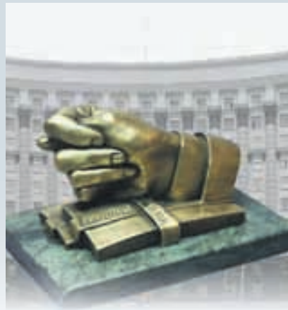
ВІТЕР У ГАМАНЦІ